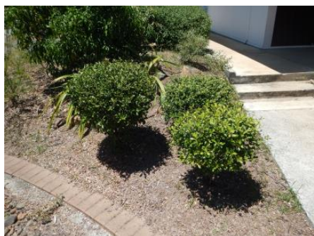
Vue d'ensemble de Cleidion verticillatum en aménagement, les plantes sont âgées de 3 ans et issues de boutures