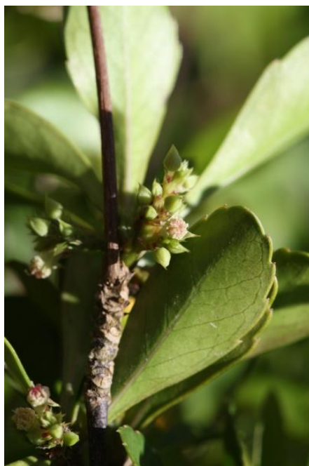
Inflorescence de Cleidion verticillatum