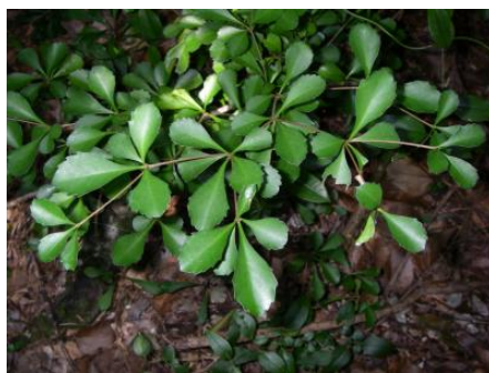
Détail du feuillage de Cleidion verticillatum