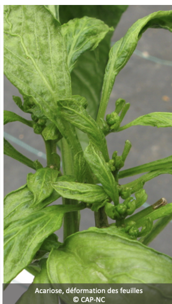
Acariose, déformation des feuilles