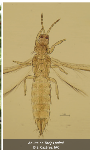
Adulte de Thrips palmi

Symptômes de trois ravageurs du poivron.