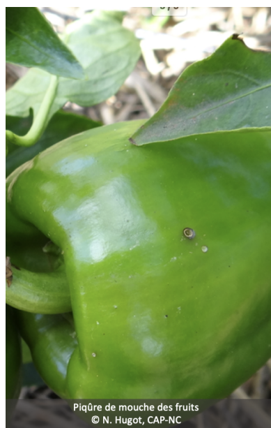
Piqûre de mouche des fruits

En Nouvelle-Calédonie, les principaux ravageurs observés sont les suivants :