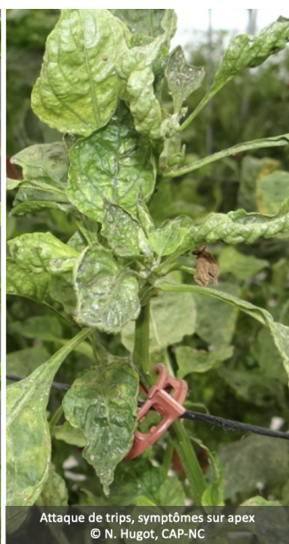
Attaque de thrips, symptômes sur apex