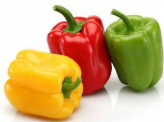
Poivron vert au stade immature, rouge et jaune à maturité